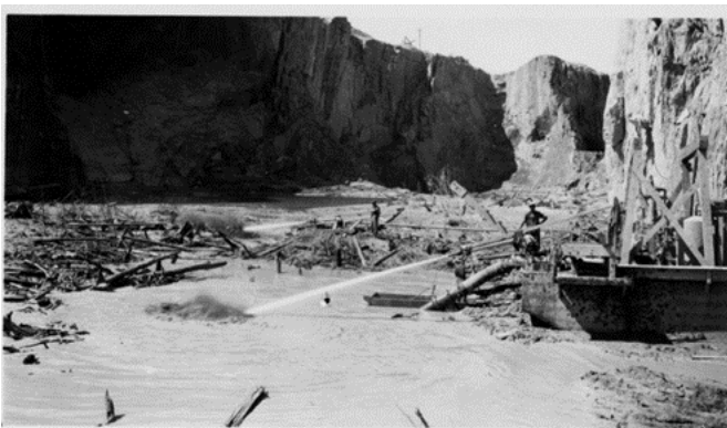
Nettoyage de glaise au chantier Glory-Hole septembre 1944