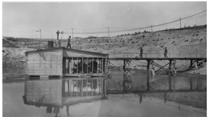
Station de pompage du Glory-Hole