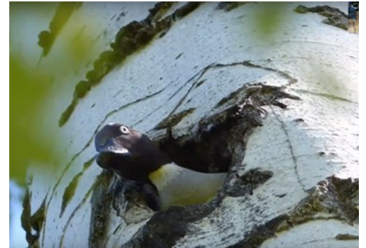
Garrot à œil d'or