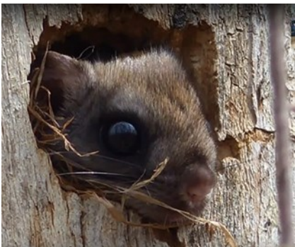
Grand polatouche

Ces cavités, une fois créées par les pics, peuvent ensuite être utilisées par une foule d'autres animaux. Voici quelques exemples, parfois surprenants, de ce que l'équipe de chercheur a pu observer : hirondelle bicolor, quiscalc bronzé, crécerelle d'Amérique, petite nyctale, chouette rayée, harle couronné, canard branchu, garrot à œil d'or, couleuvre rayée, écureuil roux, tamia rayé, grand polatouche, raton laveur. Nul besoin de vous dire donc toute l'importance que les pics ont sur la biodiversité de nos forêts, puisqu'ils fournissent des habitats pour une foule d'espèces. Il faut aussi souligner l'importance des gros et vieux arbres, parfois dépérissants ou même presque morts, qu'on appelle parfois des arbres fauniques en raison de leur importance pour la faune.