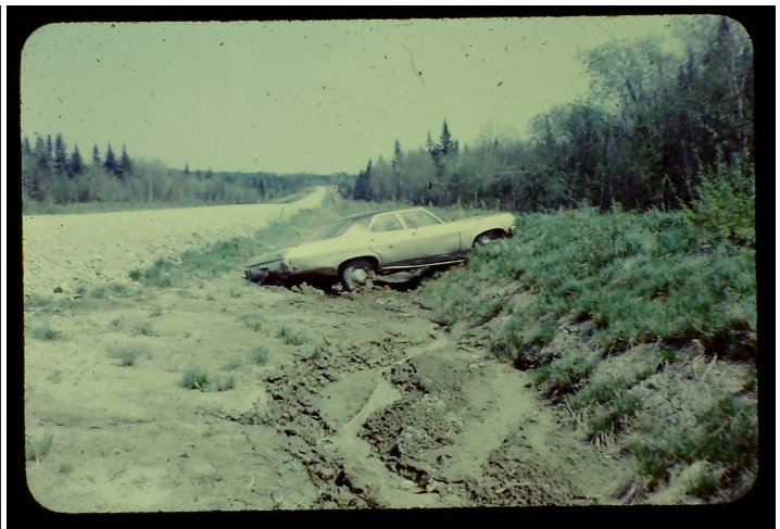
image 2: Sortie de route d'une Chevrolet Biscayne 1970 lors de la mise à niveau de la chaussée du 9-Miles