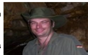
Auteur : Stéphane Mongrain

La 393 commence à cette jonction, encore souvent appelée « Coin Marouf » 1 . Elle se dirige vers l'Ouest, passe par Duparquet où elle tourne vers le nord, traversant tout l'Abitibi-Ouest, pour finalement atteindre Val-Paradis.