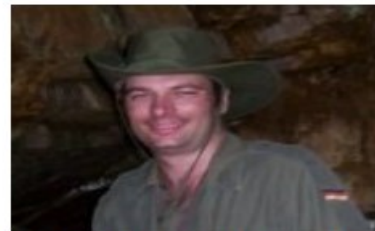
Auteur : Stéphane Mongrain