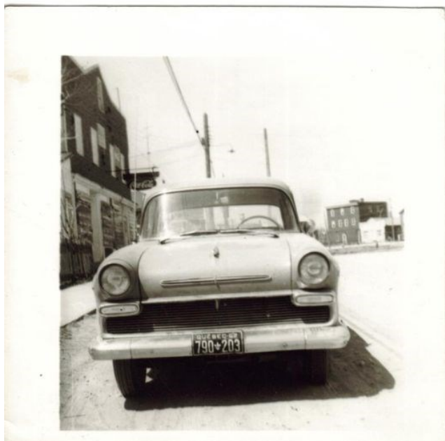
Photo 1: épicerie de John Mladi au début des années 1960