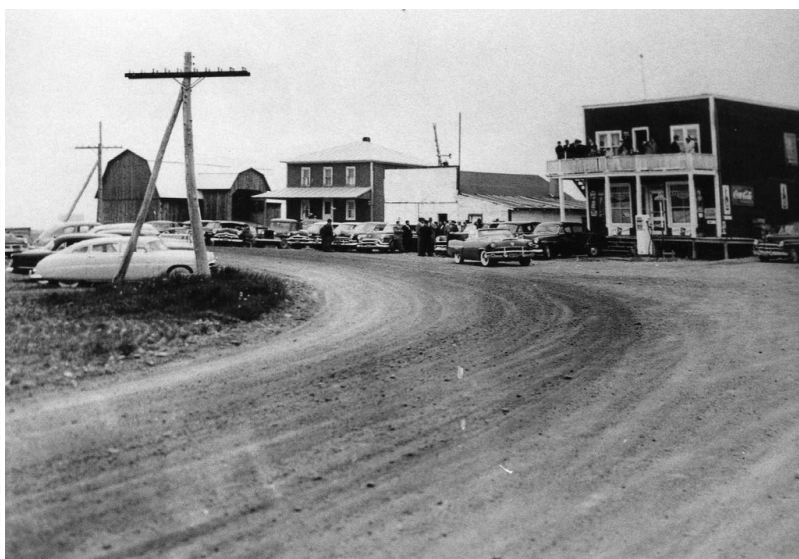
Photo 2: magasin de Genest st-Pierre